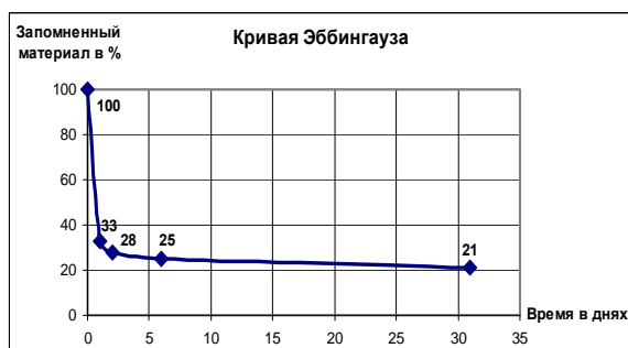
Рис. 1. Кривая забывания по Эббингаузу

Американский психолог М. Джонс провел подобный эксперимент для проверки процесса