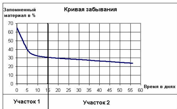
Рис. 2. Кривая забывания Джонса с делением на участки

Принимая во внимание опыты Эббингауза и Джонса, можно предположить, что процесс забывания знаний у студентов нашего ВУЗа протекает в соответствии с кривой забывания Джонса. На наш взгляд, очевидно, что данная кривая состоит из двух участков: 1 – участок экспоненциальной зависимости; 2 – участок линейной зависимости (рис. 2).