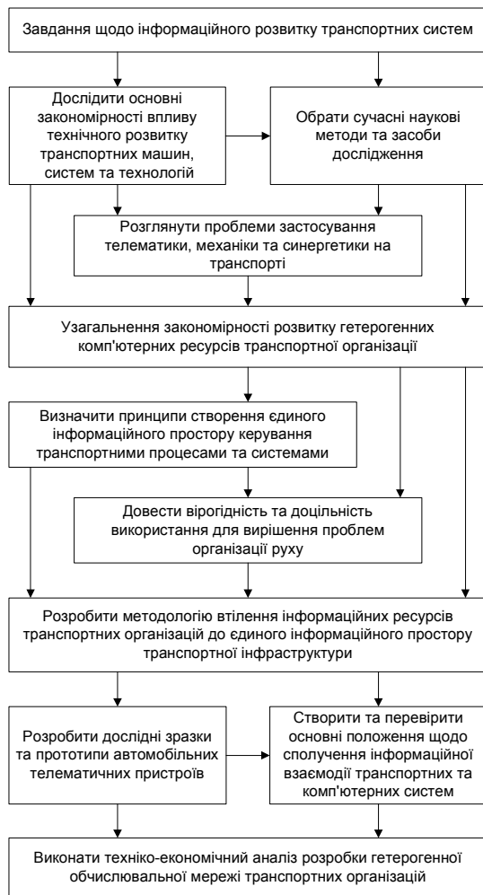
Рис. 3. Інформаційний розвиток транспортної системи

Для створення єдиного інформаційного простору транспортних організацій потрібно вирішити чимало задач. Їх вирішення полягає в узагальненні закономірностей розвитку гетерогенних комп'ютерних ресурсів вузькоспеціалізованих організацій та розробки методології їх конвергенції із загальним інформаційним середовищем (рис. 3).