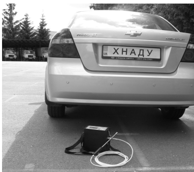
Рис. 3. Оцінка забруднення повітря

Третій експеримент полягав в оцінці стану примагістрального повітря на найбільш завантажених вулицях міста. Практично була проведена перевірка на перехресті вулиці Пушкінської та вулиці Весніна. Аналіз показав, що на перехресті вміст монооксиду вуглецю в повітрі становить 10,3 \text{ мг/м}^3 , а вміст оксиду азоту – 0,1 \text{ мг/м}^3 .