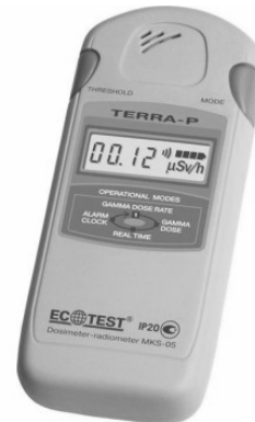
Рис. 2. Дозиметр-радіометр ТЕРРА-П

Для радіометричної зйомки місцевості в районі автомобільної дороги по вулиці Пушкінській був використаний прилад ТЕРРА-П (рис. 2). Він дозволяє оцінити еквівалентну дозу гамма-випромінювання, її потужність, щільність потоку бета-частинок.