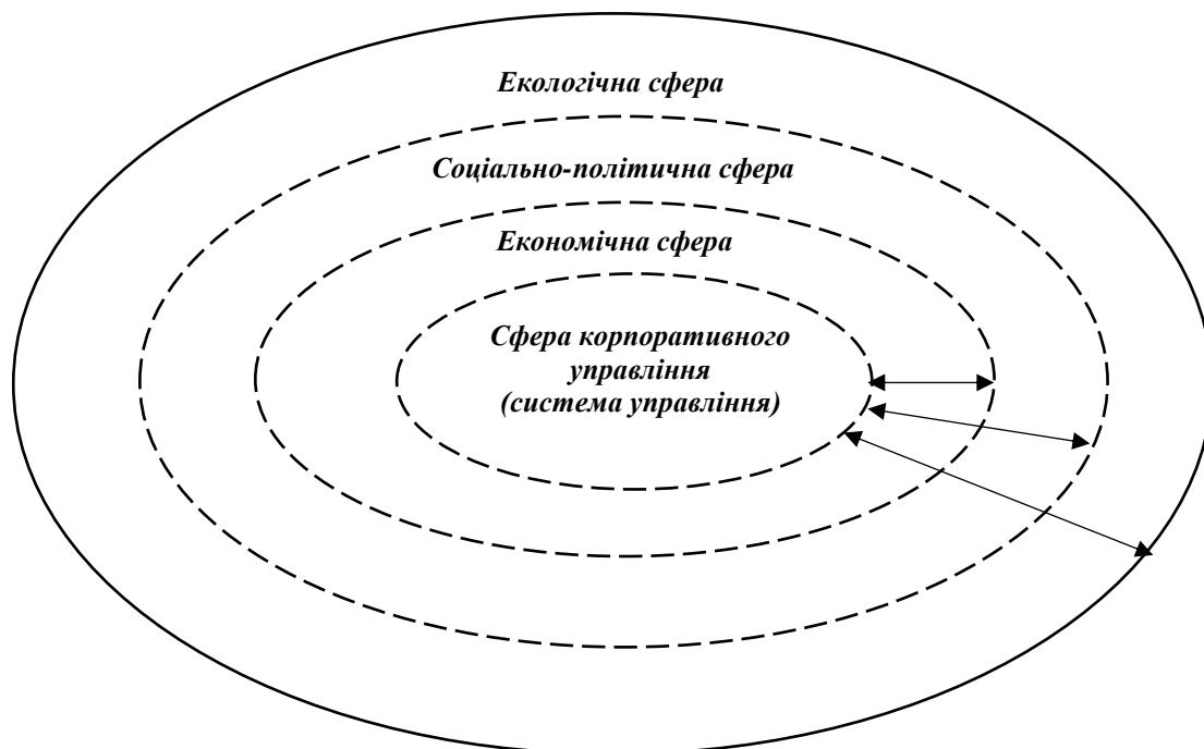
Рис. 3. Модель концепції сталого розвитку життєздатного підприємства

Таким чином, підприємство, як відкрита система, для досягнення цілей сталого розвитку взаємодіє з зовнішнім середовищем, яке представлено у вигляді сукупності трьох сфер: екологічної, соціально-політичної та економічної. Але триєдина концепція сталого розвитку відображає взаємодію підприємства з зовнішнім середовищем, і до цієї моделі також потрібно додати підсистему, яка відповідає за управлінську складову підприємства, що відображена у концепції ESG, – корпоративне управління (governance). Ця складова орієнтована на формування взаємовідносин з зацікавленими сторонами в інших трьох сферах сталого розвитку (економічній, соціально-політичній та екологічній). У контексті прагнення підприємства до сталості та підтримання життєздатності, можемо окреслити ідеалізовану структуру множини пов'язаних підсистем. Ці підсистеми у взаємозв'язку формують модель концепції сталого розвитку підприємства, наведену на рис. 3.