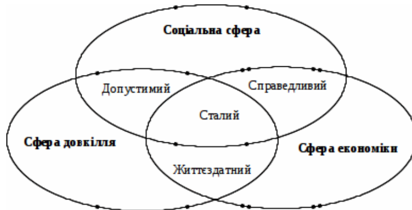
Рис. 1. Триєдина концепція сталого розвитку [5, с. 26]

На думку більшості вчених, ця модель концепції сталого розвитку базується на методичному підході, при якому екологічний соціальний та економічний компоненти наведені як рівноправні компоненти цілісної системи, таким чином їх взаємодії виникають певні властивості системи або характеристики (життєздатний, допустимий, справедливий та сталий розвиток).