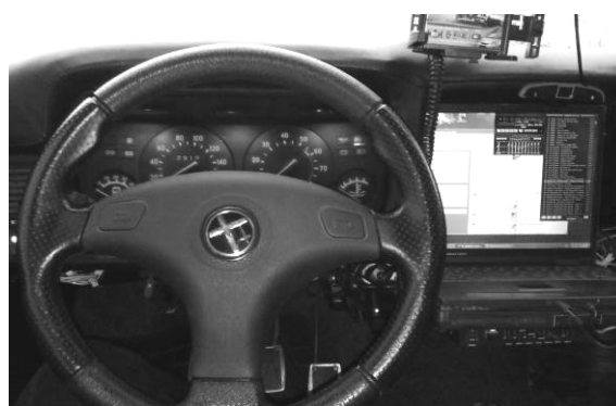
Рис. 1. Установленный компьютер в модернизированную переднюю панель автомобиля

На базе разработанной компьютерной системы голосового управления бортовыми функциями автомобиля [4], создан модуль контроля водителя на факт засыпания [5]. Данная система сможет быть интегрирована в обычный автомобиль, и при этом обеспечивать, как и удобство во время езды, так и безопасность (рис. 1).