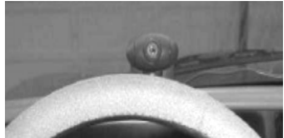
Рис.4. Расположение камеры

В ходе эксперимента, сутью которого было получить различия между открытыми и закрытыми глазами водителя, были получены следующие результаты. Видеокамера была закреплена на лобовом стекле автомобиля (рис. 4).