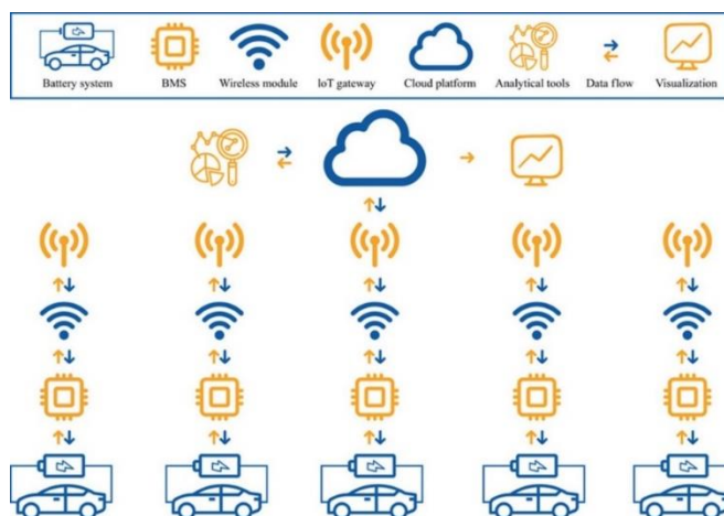
Рисунок 1 – Архітектура Інтернету акумуляторних батарей електромобілів [3]

Архітектура Інтернету акумуляторних батарей ІоВ електромобілів проілюстрована на рисунку 1 [3].