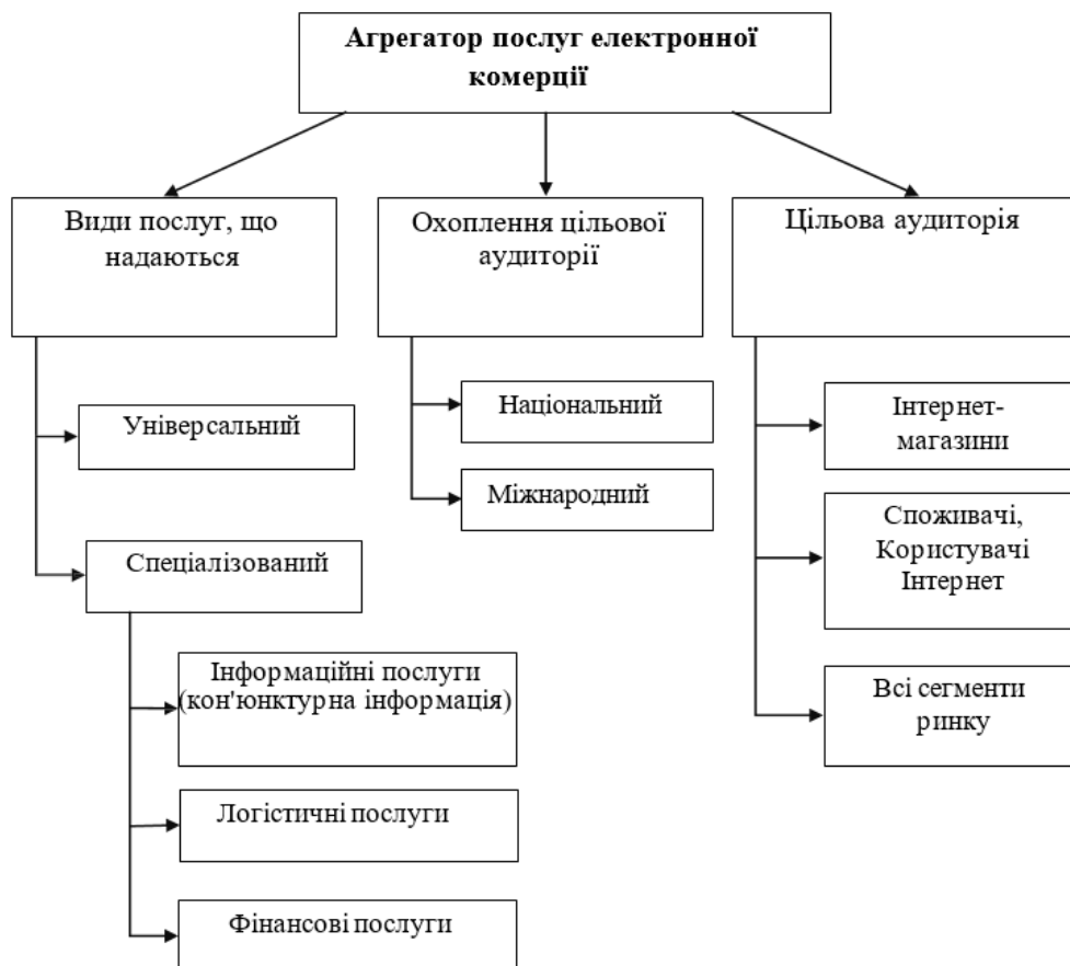
Рис. 2. Класифікація агрегаторів послуг електронної комерції

функціонуючи за моделями: B2B (Business-to-business), B2C (Business-to-consumer) і навіть C2C (Consumer-to-consumer); надання послуг виключно інтернет-магазинам, або інтернет-магазинам, аукціонам, сайтам спільних покупок тощо.