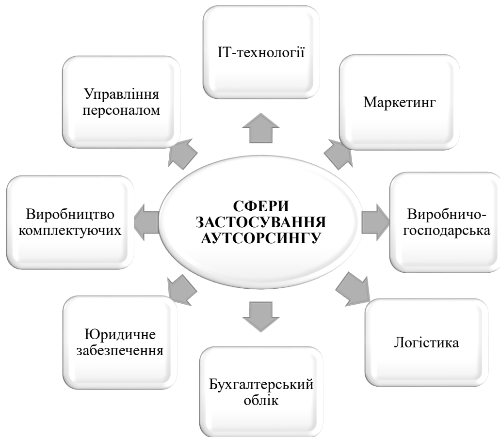
Рис. 1. Основні сфери застосування аутсорсингу (доповнено авторами на основі джерела [2])