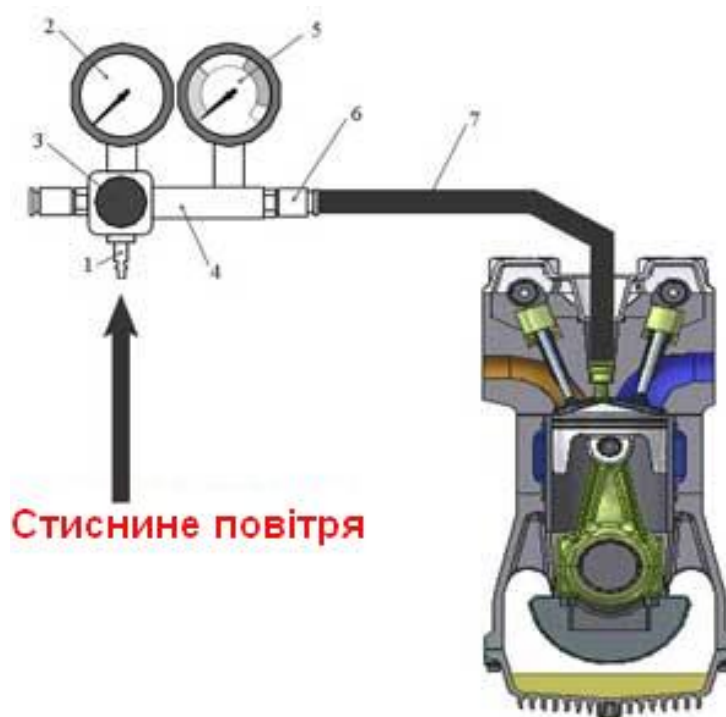
Рис. 1. Схема роботи пневмотестера: 1 - вхідний штуцер, у який подається стиснене повітря із тиском 6-10 Атм; 2 - манометр для виміру тиску підведеного стиснутого повітря; 3 - регулятор тиску підведеного стиснутого повітря; 4 - зворотній клапан; 5 - манометр для виміру тиску в просторі циліндра над поршнем, який дорівнює тиску підведеного стиснутого повітря за мінусом витоків, так само його ще називають манометр контролю втрати повітря; 6 - вихідний штуцер; 7 - шланги та адаптери для підключення до отвору

Типова схема підключення пневмотестера та його зовнішній вигляд представлено на рис.1.