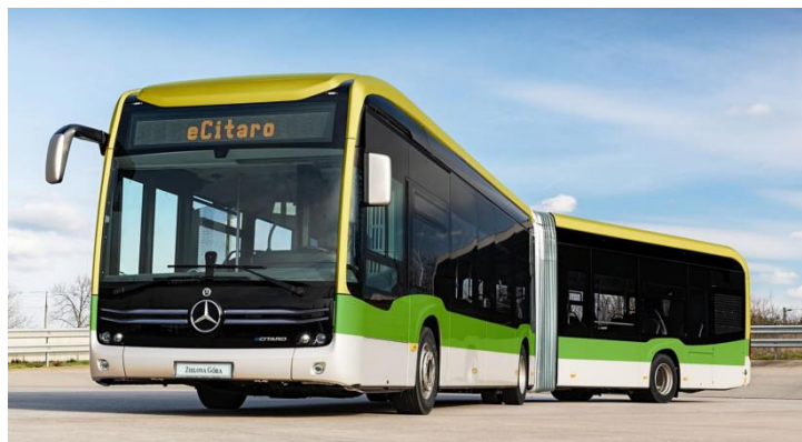
Рис.1 – Рухомий склад, який працює на маршрутах м. Зелена Гура

Рухомий склад в місті Зелена Гура є екологічно чистим. Всі автобуси є на електродвигунах. Це автобуси марки Mercedes-Benz eCitaro G пасажиромісткістю 80 та 122 пасажири (рис.1).