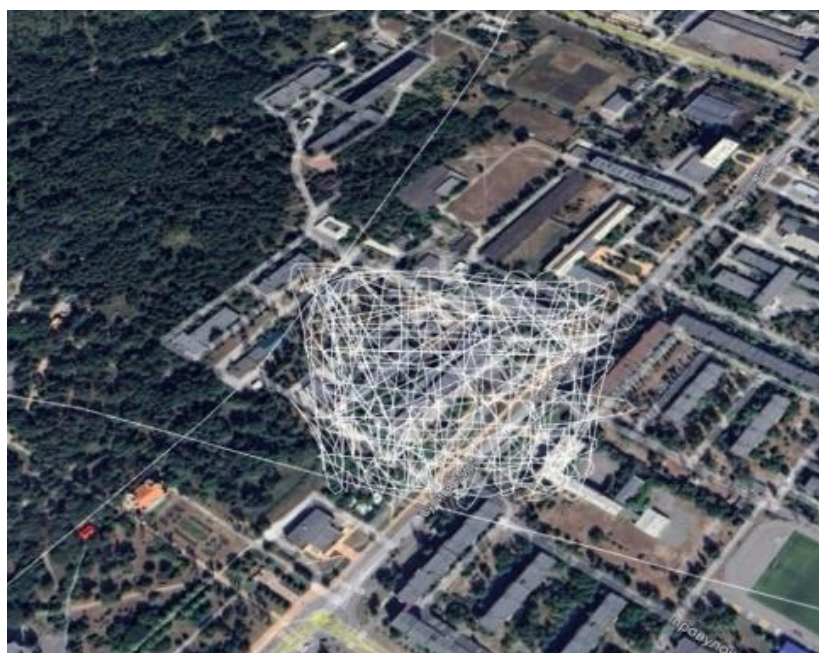
Рисунок 1 – Ділянка земної поверхні на Google Earth

Для побудувати ЦМР використовуємо безкоштовну програму Google Earth [1], яка дозволяє сформувати масив точок ділянки земної поверхні як координати полілінії (рис. 1) та зберігаємо у вигляді файлу з розширенням .kml .