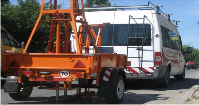
Рисунок 3 – Динамічна установка «ДІНА-3М»

Наприкінці 70-х – початку 80-х років в ХАДІ були сконструйовані установки для експрес-випробувань дорожніх одягів: УНК-ХАДІ – для безперервного контролю міцності дорожнього одягу на базі автомобіля КРАЗ.