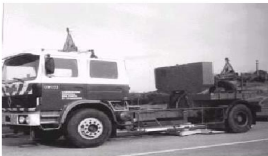
Рисунок 5 – Дефлектограф FLASH