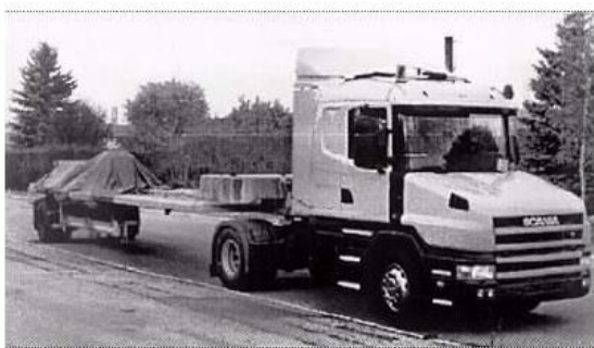
Рисунок 6 – Високошвидкісна установка вимірювання прогину (High Speed Deflectograph)

Збір більш повної інформації про стан дорожніх одягів проводиться за допомогою пересувних лабораторій, які обладнані комплексом устаткування, призначеного для збору інформації про стан покриття. Прикладом є система візуальної оцінки покриття дороги SOWA-1 (Польща); лабораторія Videoroute (Франція); лабораторія Videocar (Данія).