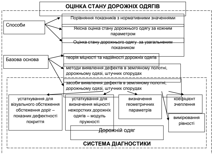
Рисунок 1 – Принципова схема оцінки стану дорожніх одягів

способом підвищення вірогідності даних є переведення таких робіт з категорії візуального в розряд інструментального обстеження. Засоби автоматизації збору даних про дефекти, що розроблені в останні роки, дозволяють підвищити якість і вірогідність інформації, що одержується.