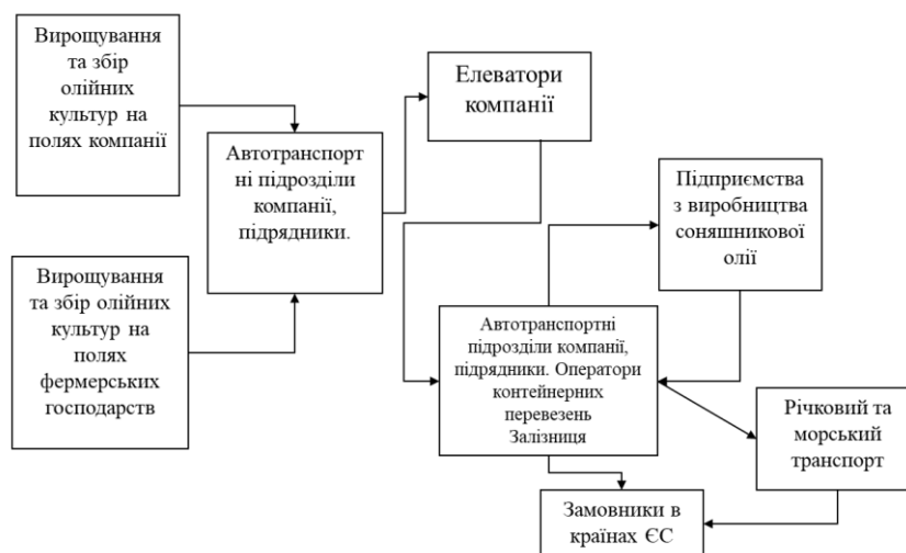
Рисунок 3. Структурна модель послідовної взаємодії між учасниками процесу доставки компанією «Кернел Трейд»

Система доставки сільськогосподарських вантажів, в тому числі соняшникової олії, на прикладі компанії «Кернел Трейд», має відповідну структуру, засновану на взаємодії учасників: оператори компанії (агент-трейдер), який виступає в якості організатору експорту продукції, виробничих підрозділів (структурні сільськогосподарські підрозділи компанії «Кернел Трейд» (виросшують та обробляють на землях, які належать або орендовані компанією), фермери; інші сільськогосподарські підприємства; переробні підприємства), систем збереження (елеватори, складські системи), транспортних компаній (структурні підрозділи компанії та сторонні автотранспортні підприємства, експедиторські компанії, логістичні центри), а також існуючої інфраструктури портів, залізниць, мереж автомобільних доріг (рис.3).