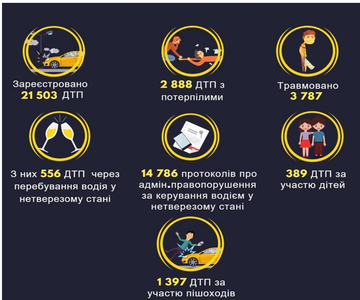
Рисунок 1. Статистика ДТП в Україні за січень – лютий 2018 року.

За два місяці цього року в країні зареєстровано 21,5 тисяча дорожньо-транспортних пригод. Це на 4,2 тисячі менше, аніж у січні-лютому минулого року.