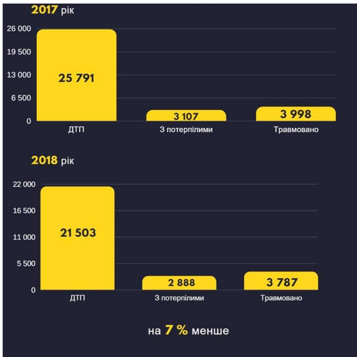
Рисунок 2. Динаміка ДТП та їх наслідків за січень – лютий 2018 року у порівнянні з аналогічним періодом 2017 року.

У цьогорічних дорожньо-транспортних пригодах 363 людини загинуло, 3787 осіб — травмовані.