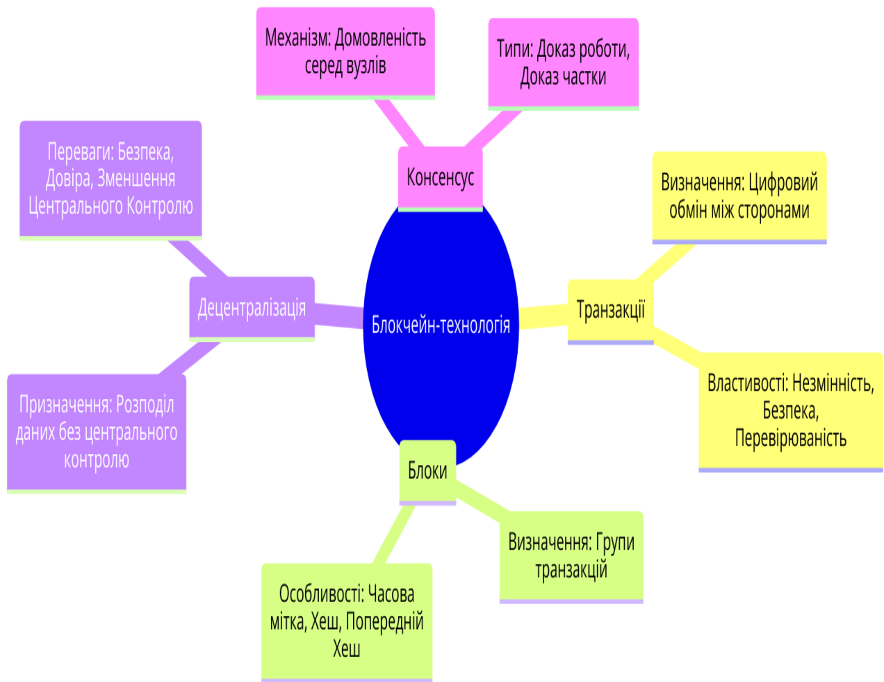
Рис. 1. Основні складові блокчейн-технології для транспортної галузі

Транзакції представляють цифровий обмін між сторонами, зберігаючи властивості незмінності, безпеки та перевірюваності. Блоки складаються з груп транзакцій і містять унікальні особливості, такі як часова мітка та хеш попереднього блоку, що забезпечує цілісність ланцюга блоків.