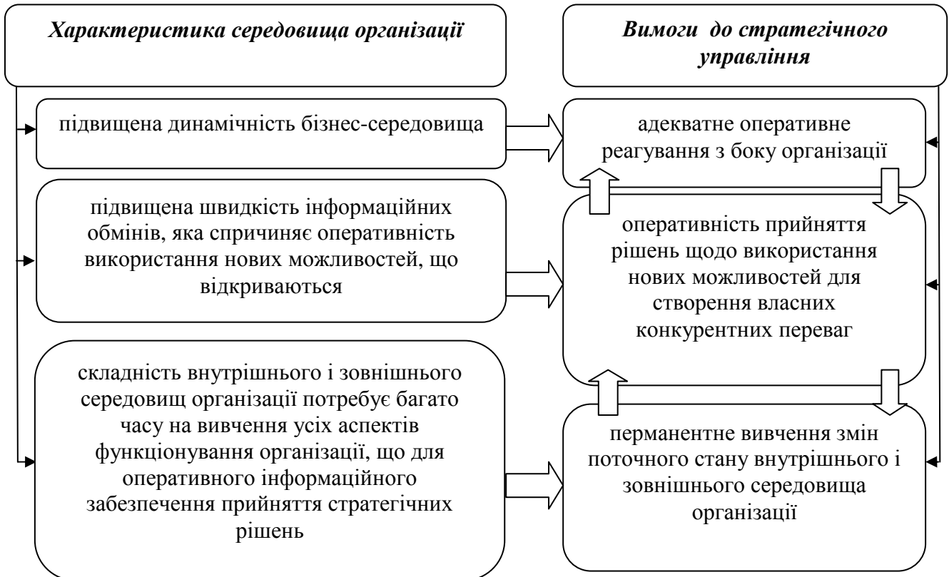
Рисунок 2 – Вимоги до сучасного стратегічного управління в умовах динамічного бізнес-середовища

Сучасна концепція стратегічного управління має передбачати безперервність і практичну одночасність виконання усіх базових процесів стратегічного управління. Така ситуація спричинена умовами середовища організації, які потребують певних вимог до стратегічного управління, які зображено на рис. 2.