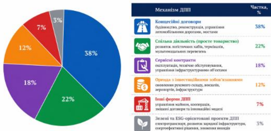
Рис. 2. Структура застосування механізмів державно-приватного партнерства у розвитку транспортної інфраструктури на засадах ESG

У практиці реалізації проєктів державно-приватного партнерства транспортний сектор традиційно посідає провідне місце, оскільки саме в цій сфері зосереджена значна частина інфраструктурних інвестицій. Різні сегменти транспортної системи характеризуються відмінною структурою використання партнерських механізмів, що пов'язано з особливостями інвестиційних потреб, технологічних параметрів інфраструктури та моделей управління об'єктами. Узагальнена структура застосування основних механізмів державно-приватного партнерства у транспортному секторі представлена на рис. 2.