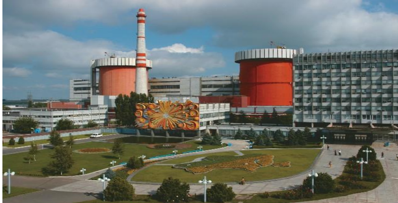
Рисунок 2 – Південно-Українська АЕС потужністю 3000 МВт