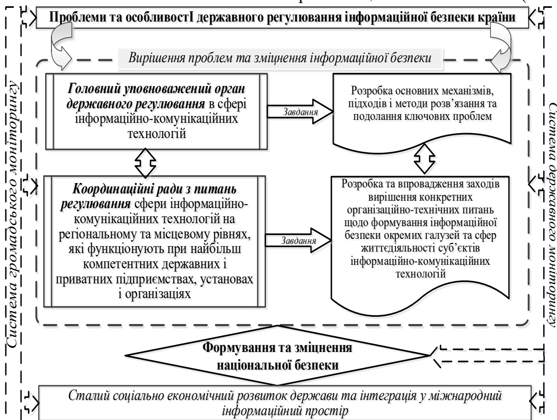
Рис. 3. Механізм вирішення проблем державного регулювання у сфері інформаційно-комунікаційних технологій

Для здійснення загальної координації вирішення зазначених проблем має ефективно функціонувати відповідна уповноважена державна структура з питань інформаційної безпеки, яка б визначала конкретні підходи та методи їх вирішення та подолання. Водночас пропонується запровадити мережу координаційних рад, які діятимуть на найбільш компетентних державних і приватних підприємствах, установах та організаціях. Основним завданням цієї мережі координаційних рад буде вирішення конкретних організаційно-технічних проблем у сфері формування інформаційної безпеки в окремих галузях і сферах життєдіяльності суб'єктів інформаційно-комунікаційних технологій з метою посилення загального рівня національної безпеки. (Рис. 3).