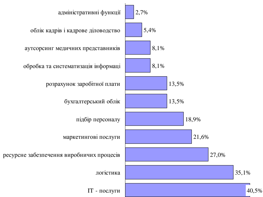
Рисунок 3 - Рейтинг бізнес-процесів які передаються на аутсорсинг в Україні [5]

Отримані дані кореспондують з загальносвітовими тенденціями: лідером аутсорсингу в Україні є IT-аутсорсинг так у 2016 р. приріст