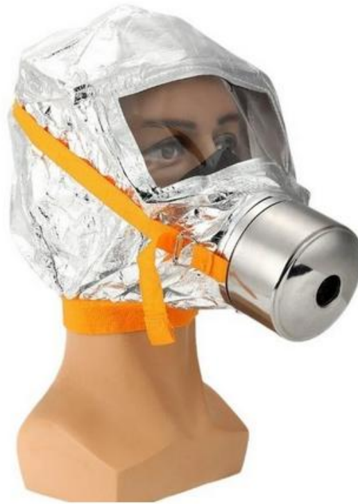
Рисунок 2 – Фільтруючий респіратор «Sheng An TZL-30»