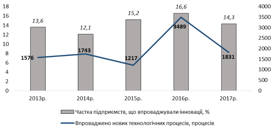
Рисунок 2 – Динаміка впровадження інновацій на промислових підприємствах в Україні протягом 2013-2017 років [1]

Крім цього, на рис. 2 представлено динаміку впровадження інновацій на промислових підприємствах.