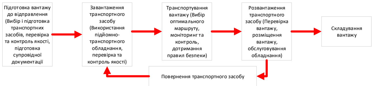
Рисунок 1 – Технологічна схема доставки навалочних вантажів

Вибір раціонального рухомого складу. Раціональний вибір рухомого складу залежно від об'єму, ваги вантажу та умов транспортування [1-3]. Оцінка вантажопідйомності, економічності та екологічності рухомого складу [Ошибка! Источник ссылки не найден.-Ошибка! Источник ссылки не найден.]. Оптимізація використання транспорту для мінімізації простоїв та максимізації завантаженості.