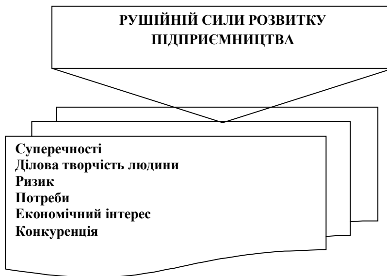
Рис. 2. Основні рушійні сили розвитку підприємництва

Важливими рушійними силами підприємництва є також економічний інтерес та економічна конкуренція (рис. 2).