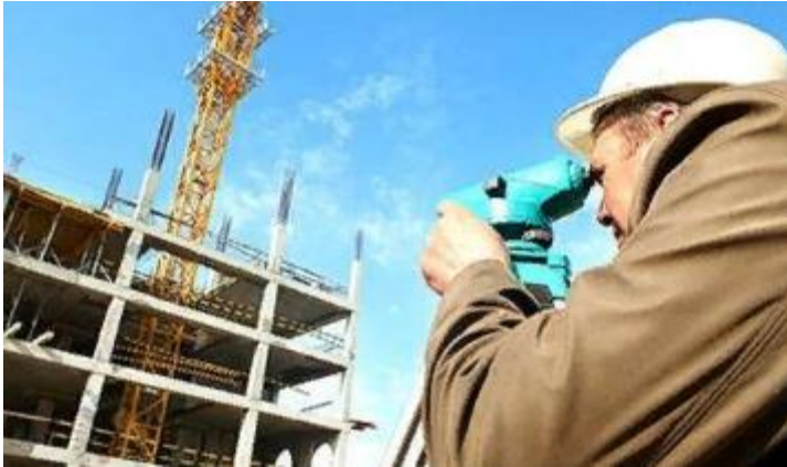
Рисунок 2 – Виконання зйомки на будівництві

застосовується (похибки, обумовлені недосконалістю прийнятого методу вимірювання) (рис.2) [2].