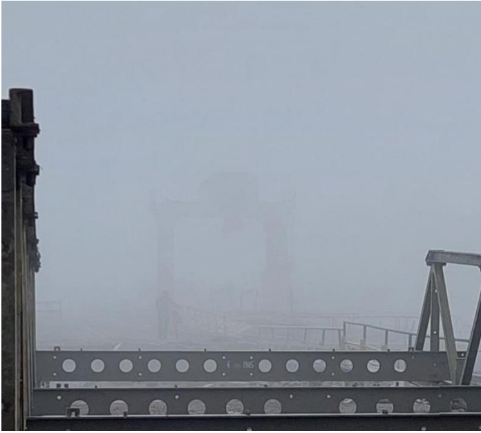
Рисунок 3 – Погані погодні умови (туман)

Геодезистам нерідко доводиться стикатися з усіма цими перешкодами на шляху до вирішення поставлених завдань [3]. Але існують методики та обладнання, здатне мінімізувати вплив зовнішніх негативних факторів.