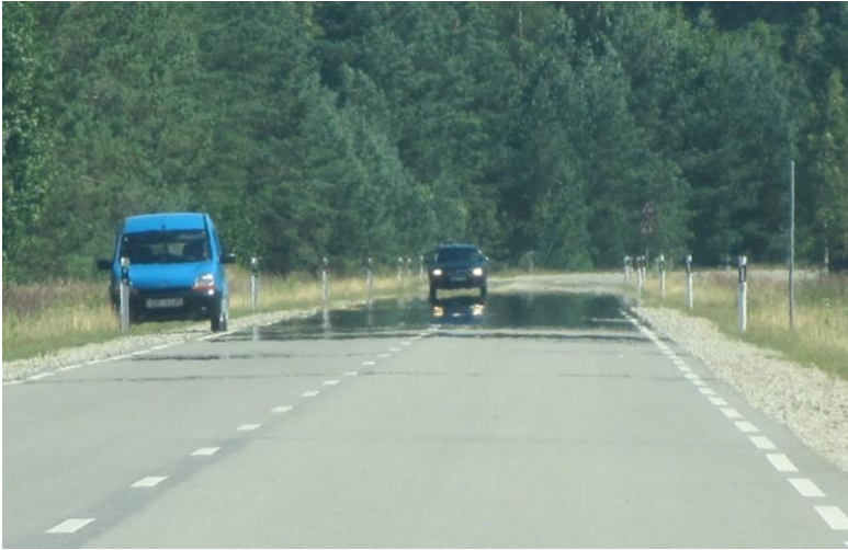
Рисунок 4 – Рефракція на дорозі

Вона є наслідком проходження візирного променя через повітряні шари з різною щільністю, яка залежить від розподілу температури [6]. Тому рефракційне поле ототожнюється з температурним полем та значенням кута рефракції, що визначається як: