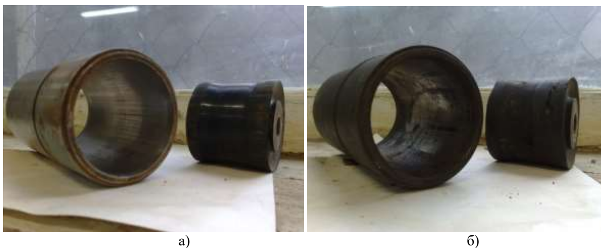
Рис. 2. Циліндро-поршнева група після напрацьованого ресурсу роботи: (а) гільза, виготовлена зі сталі 40Х поршень виготовлений із гуми СКЭП-50-46-56; (б) гільза, виготовлена зі сталі 70 поршень виготовлений із гуми СКМС-26АСМ

но прилягає до дзеркала циліндра, і ефективно виконує свою функцію при зворотно-поступальному русі поршня. Така конструкція суттєво підвищила ресурс роботи циліндро-поршневої групи.