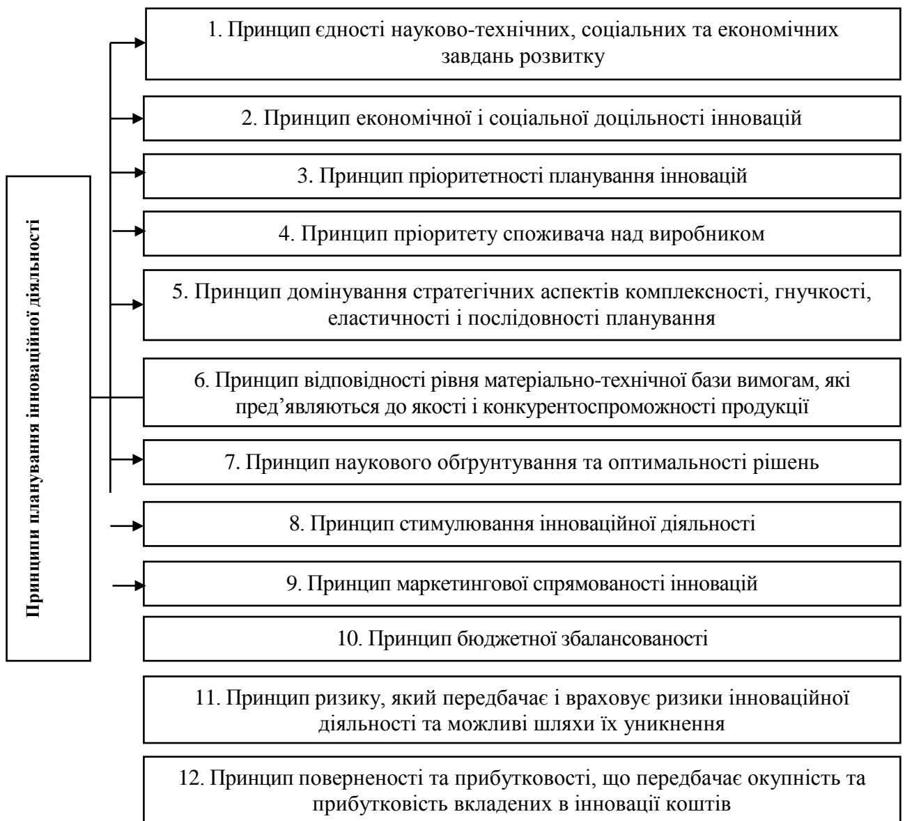
Рис. 2. Основні принципи планування інноваційної діяльності

Здійснення інноваційної діяльності підприємств спрямоване на досягнення певних економічних результатів, завдань господарського і фінансового розвитку.