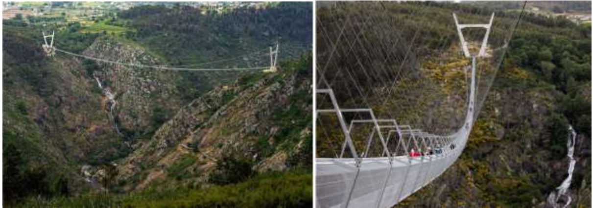
Рисунок 5 – Пішохідний міст Arouca Bridge (Португалія)

розташований на висоті 175 м над річкою Пайва біля невеликого північного м. Арока. Конструкцію мосту довжиною 516 м зводили близько двох років, вартість робіт оцінюється в 2,3 млн. євро.