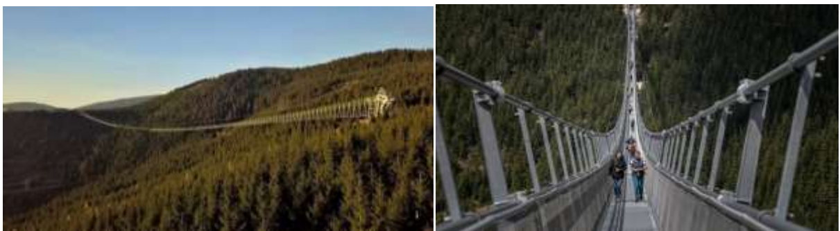
Рисунок 6 – Пішохідний міст на курорті Дольні Морава (Чехія)

У Чехії, на курорті Дольні Морава в 2022 р. відкрився найдовший підвісний пішохідний міст у світі. Міст завдовжки 721 м отримав відповідну назву Sky Bridge 721 (рис. 6).