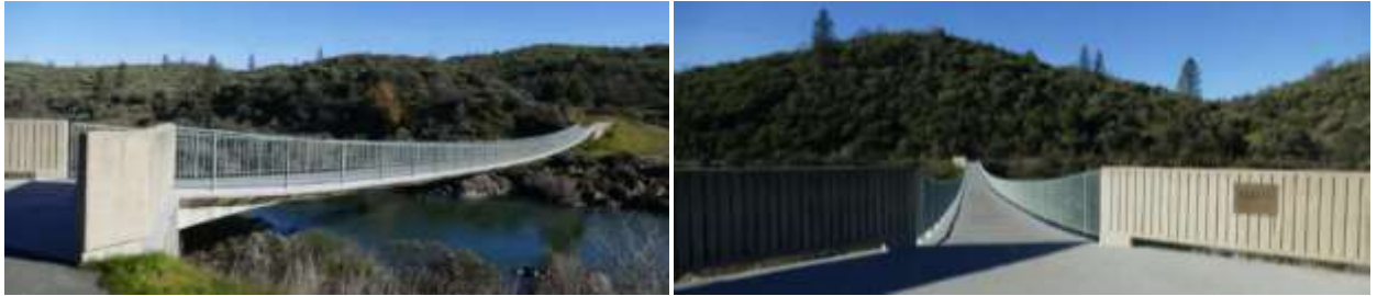
Рисунок 2 – Пішохідний міст через річку Сакраменто (США)

Одним із таких мостів-стрічок є міст через річку Сакраменто в США з прогоном довжиною 127 м (рис. 3).