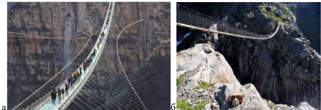
Рисунок 4 – Пішохідні мости-стрічки: а - міст Коконое Юме (Японія); б - міст Шарля Куонена (Швейцарія)

До теперішнього часу у світі побудовано більше двадцяти мостів-стрічок капітального типу, більша частина з них, це пішохідні мости. Одним із найвищих пішохідних мостів у світі є міст Коконое Юме у Японії, довжина якого складає 390 м (рис. 4, а). Ще довшим підвісним мостом став у 2017 р. міст Шарля Куонена, що відкрився у Швейцарії у 2017 р., має довжину 494 м (рис. 4, б).