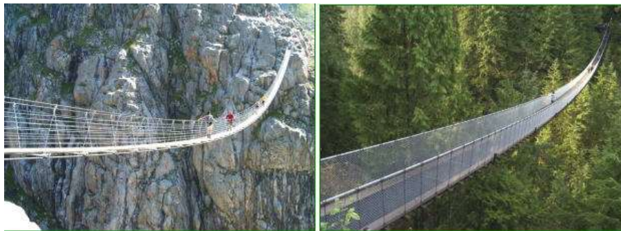
Рисунок 1 – Пішохідні висячі мости-стрічки

У практиці мостобудування є приклади однопрогонових мостів [1-3], які можна віднести до так званих безпілонних висячих систем – це стрічкові висячі мости (мости-стрічки), де проїзну частину поєднано з основними опорними елементами (рис. 1 і 2).