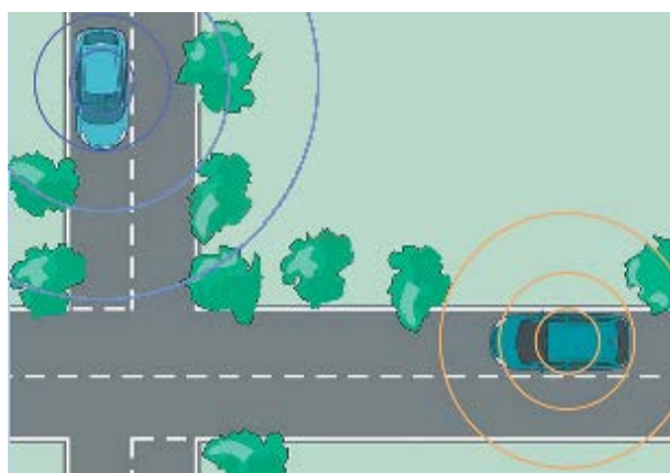
Рисунок 2 - Проезд перекрестка.

Принцип действия предлагаемой системы заключается в следующем. Транспортные средства, оборудованные GPS-приемниками, постоянно определяют свое местоположение. Приближаясь к зоне ограниченной видимости, с помощью WiFi-приемо-передатчиков автоматически создает между автомобилями коммуникационный канал. Один из автомобилей выполняет роль “сервера”, второй – роль “клиента”. “Общаясь” с помощью информационных посылок ТС прогнозируют возможность аварийной ситуации на участке с ограниченной видимостью. В зависимости от скорости сближения и расстояния до точки возможной аварии система предупреждает и автоматически тормозит одну либо обе машины.