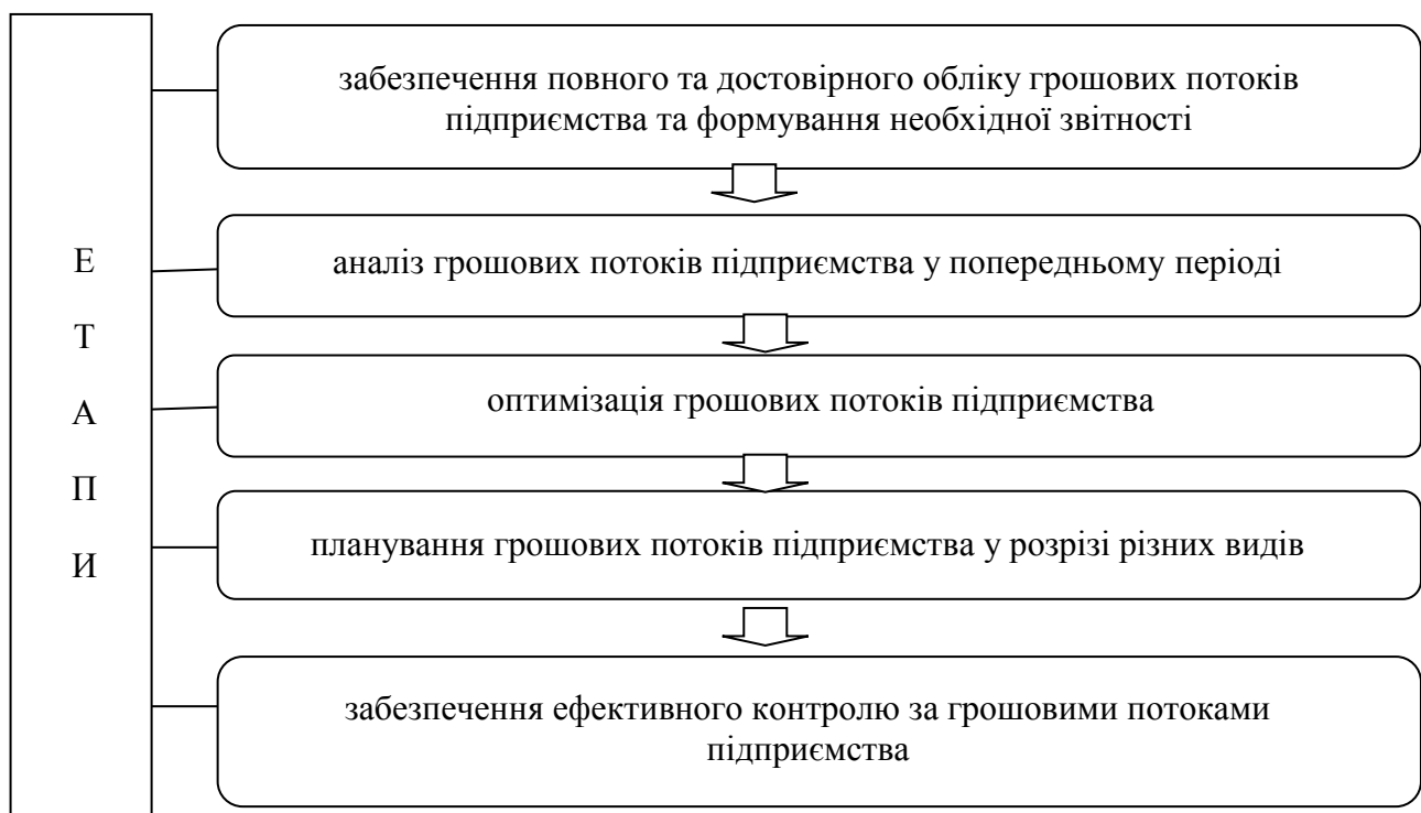
Рисунок 2 – Етапи організації процесу управління грошовими потоками

Під аналізом грошових потоків підприємства розуміють процес дослідження системи показників, їх формування на підприємстві, виявлення основних тенденцій та закономірностей з метою з'ясування резервів подальшого підвищення ефективності управління ними [2].