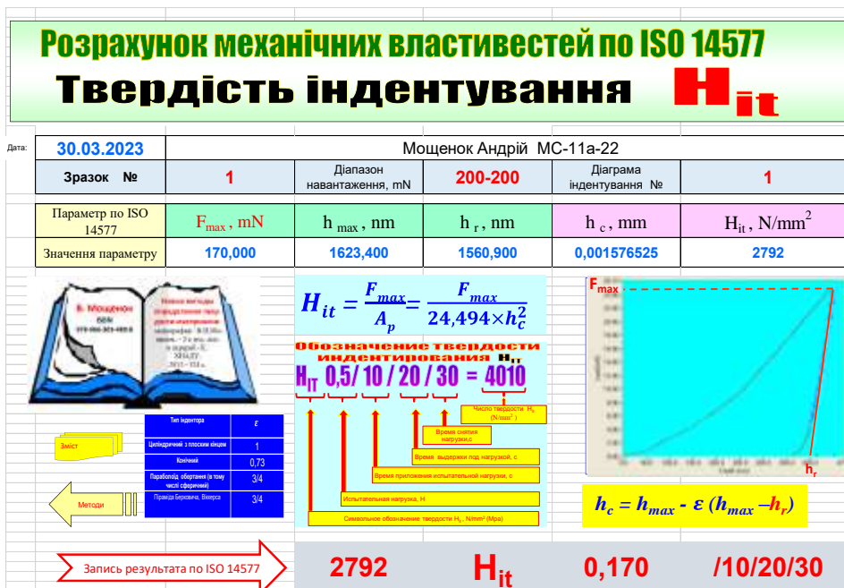
Рис. 4. Розрахунок твердості індентування для зразка №1