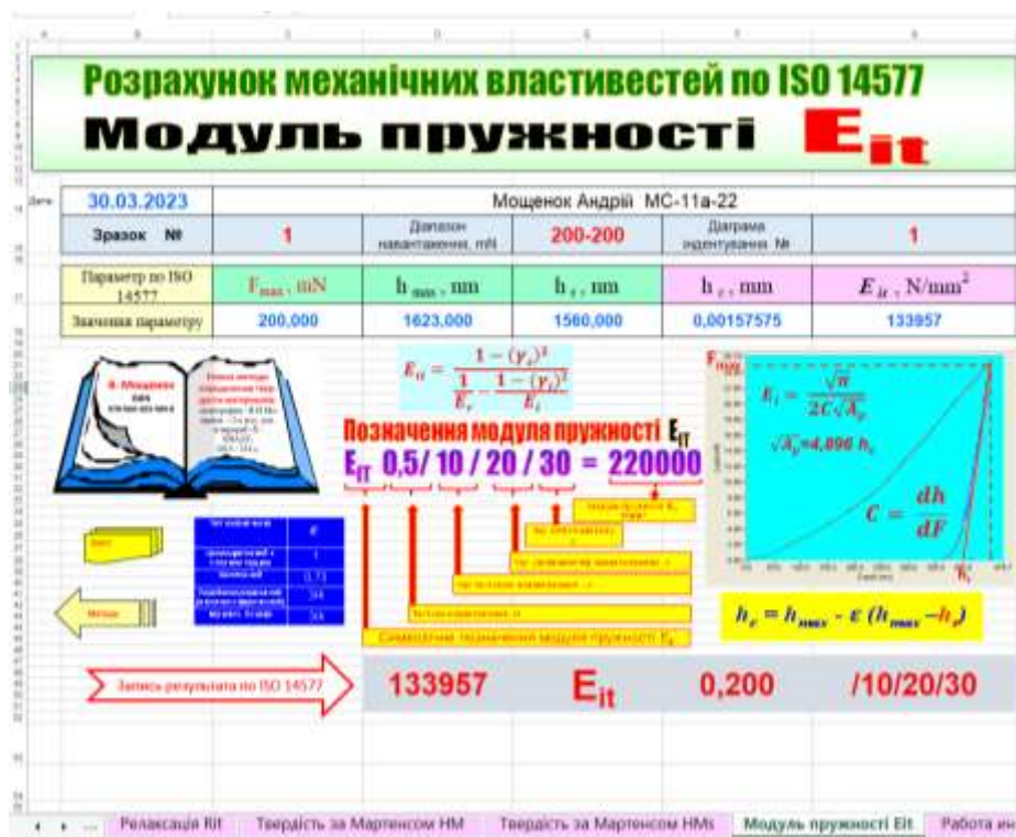
Рис. 5. Розрахунок модуля пружності для зразка №1

Залежність твердості індентування та модуля пружності в залежності від мікроструктури наведено у таблиці 2. З таблиці 2 видно, що сталеві зразки з різної мікроструктурою та твердістю за Віккерсом від 500 до 790 одиниць ( збільшення у 1,6 рази) надають також збільшення твердості індентування з 5,85 до 8,96 ГПа, тобто у 1,5 рази.