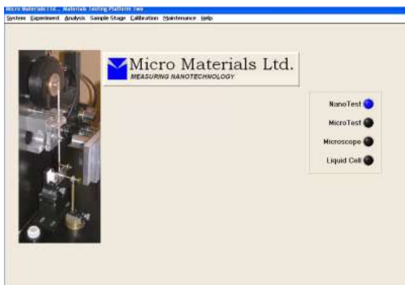
Рис. 1. Прилад NanoTest Micro Materials Ltd

Твердість інденування та модуль пружності вимірювалась на приладі NanoTest (Micro Materials Ltd) [4]. Унікальність даного приладу - горизонтальне розташування шпинделя і індентора, що дозволяє з більшою точністю визначати твердість в мікро- і нанодіапазоні. Це пов'язано з силою тяжіння, яка діє на досліджуваний зразок під час проведення випробування.