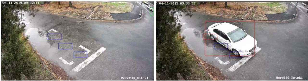
Рисунок 2 – Зображення з відеокамер на Мереф'янському шосе в районі будинку №30

На рисунку зеленим прямокутником зображено область розпізнаного автомобіля, синім – віртуальна область на дорожньому покритті, красним – перетин віртуальної площини автомобілем.