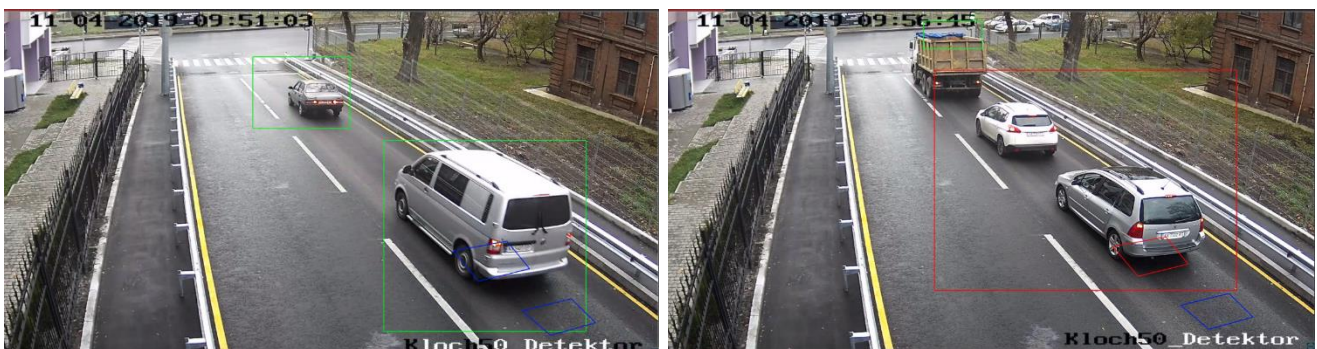
Рисунок 1 – Зображення з відеокамер на вул. Клочківській в районі будинку №50

Місто Харків продовжує встановлення ДТ на ВДМ міста. За останнє півріччя камери-детектори були встановлені на вул. Клочківській в районі будинку №50 (рисунок 1), Мереф'янському шосе в районі будинку №30 (рисунок 2).