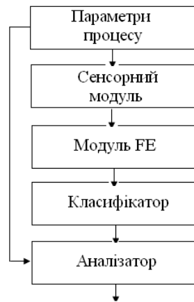
Рисунок 1 - Схема аналізатору робочого процесу

Дані сенсорів піддаються спектральному перетворенню Фур'є (модуль FE) і класифікуються штучною нейронною мережею. Потім оцінюється якість робочого процесу, ґрунтуючись на знаннях. На виході використовується монітор або запис до протоколу, щоб відбити процес під час експлуатації. Вхідні дані нейронної мережі формуються з функцій, витягнутих з виходів відповідних сенсорів. Кількість вхідних вузлів нейронної мережі, вибирається на основі кількості витягнутих ознак. Кількість вихідних вузлів залежить від необхідного дозволу класифікації [2]. Використовується алгоритм навчання мережі зворотного поширення, заснований на алгоритмі Левенберга-Марквардта (LM). Мета навчання нейромережі – знайти такі значення параметрів (ваг), при яких помилка класифікації буде мінімальною.