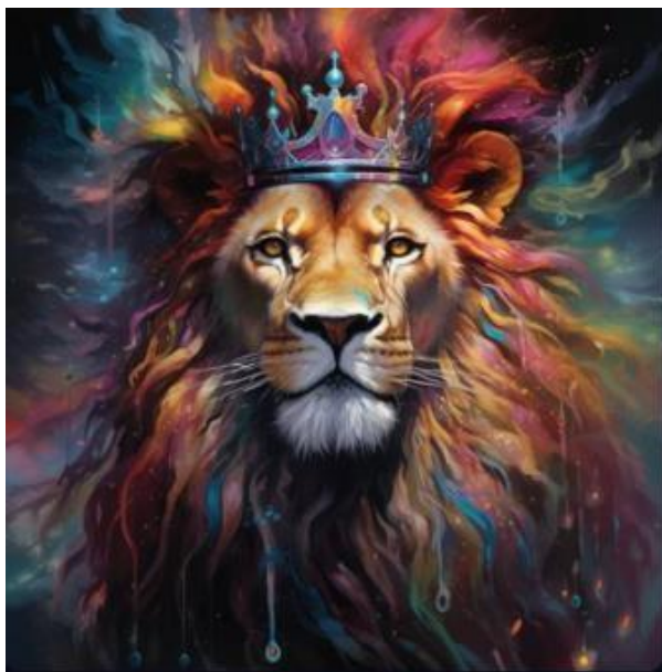
Рисунок 1. Результат роботи MidJourney

Після цього мережа генерує зображення, дозволяючи редагувати деталі, стиль або якість результату. З її допомогою можна створювати навіть ілюстровані книги. Наприклад, на запит зобразити короля лева штучний інтелект може видати результат, показаний на рисунку 1.