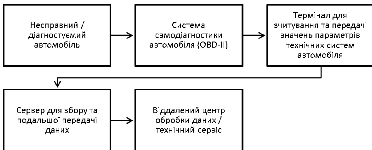
Рисунок 2 – Схема взаємодії елементів сервісу віддаленого контролю параметрів технічних систем ТЗ

трубопроводного транспорту) представлений в [3]. Принципову відмінність в блоках діагностики і моніторингу пропонується виділити [1-7] в реалізації принципу «чорного ящика» і принципу моделювання. Реалізуючи функцію спостереження, моніторинг повинен акумулювати всі дані про об'єкт управління, як об'єкті з відомими характеристиками. Діагностичний блок має справу з відхиленнями у функціонуванні об'єкта управління. У таких ситуаціях слід використовувати принципи «чорного ящика» і моделювання. Схему взаємодії елементів сервісу віддаленого контролю параметрів технічних систем ТЗ продемонстровано на (рис. 2)