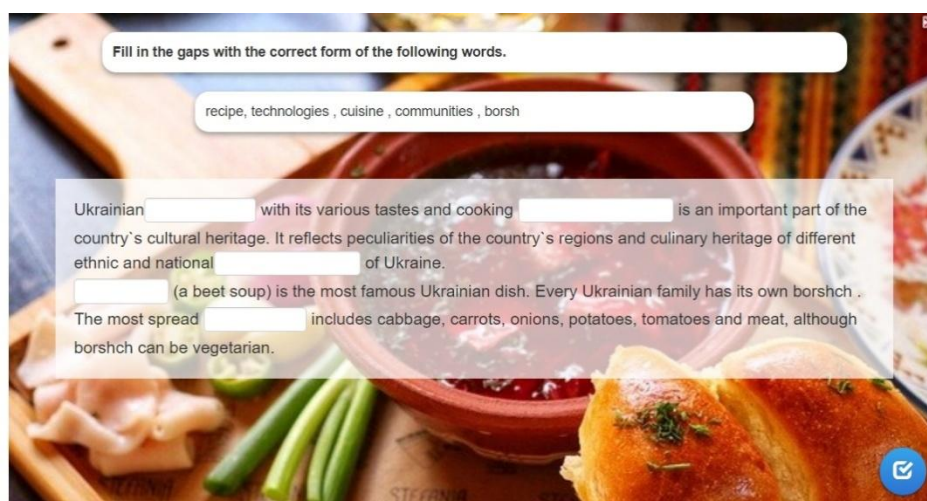
Рисунок 1 - Екранна копія інтерактивної вправи «Traditional cuisine in Ukraine»

Для того, щоб студенти могли ефективно засвоїти лексику за темою «Traditional cuisine in Ukraine» та глибше пізнати культурні особливості нашої країни, для своїх онлайн занять нами було розроблено серію вправ, одна з яких передбачала заповнення пропусків у тексті (див. рис. 1). Цей формат дозволив не лише запам'ятати нові слова, зрозуміти їхнє використання в різних контекстах, а й покращити навички читання тощо. Результати її виконання показали позитивну динаміку в розвитку словникового запасу студентів.