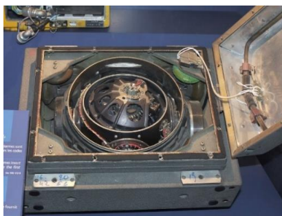
Рисунок 6 – Інерціальний вимірювальний пристрій