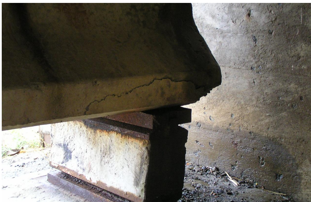
Рисунок 3 – Руйнування балки при поганій роботі опорної частини