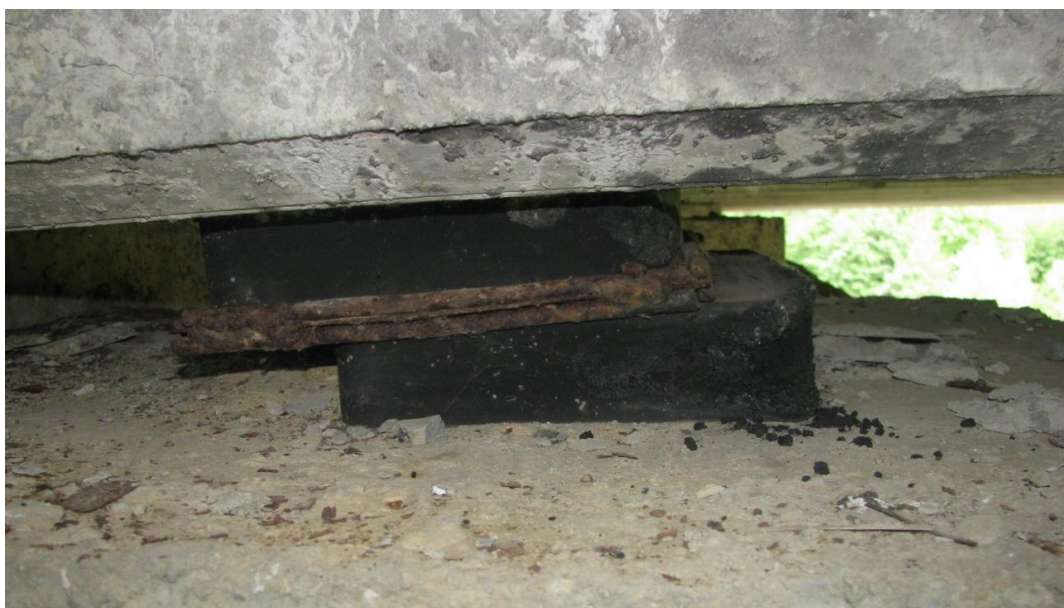
Рисунок 2 – Зсув нижньої частини гумової опорної частини вздовж балки

Руйнування бетону приопорних ділянок балок та відколи бетону з оголенням та корозією робочої арматури впливають на режим пропуску транспортних засобів по споруді. Враховуючи це, пропуск навантаження проводиться або зі зміщенням осі руху в бік, протилежний від дефектних елементів, або - по осі проїзної частини. Причиною руйнування є те, що опорна частина працює частково або ж не працює зовсім.