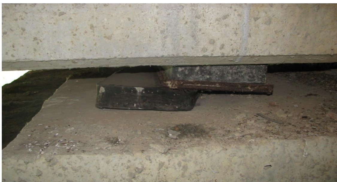
Рисунок 1– Зсув верхньої частини гумової опорної частини вздовж балки

До останнього часу в мостобудуванні застосовувалися сталеві опорні частини. Сьогодні для мостів індивідуального проектування та при використанні сучасних конструкцій, технологій і матеріалів виникла необхідність у розробці нових типів опорних частин, невеликих за габаритами та із використанням меншої кількості матеріалів. З урахуванням металоємності й вартості опорні частини ковзання із синтетичними матеріалами в автодорожніх мостах практично повністю замінили металеві. Тому при капітальному будівництві слід застосовувати ефективні опорні частини з додаванням еластомерних матеріалів: гумові, поліуретанові, стаканні, сферичні. Металеві тангенціальні, секторні й коткові елементи мосту рекомендуються використовувати при ремонті для заміни опорних частин, що вийшли з ладу.