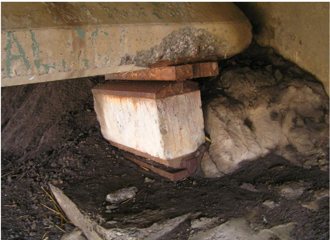
Рисунок 5 – Зсув балки відносно опорної частини і як наслідок її руйнування

У стаканних – вертикальна сила передається через стаканоподібний елемент, заповнений аморфним матеріалом –