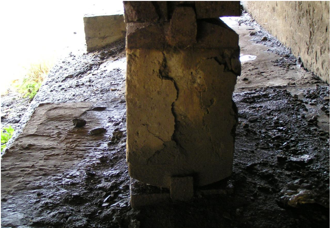
Рисунок 4 – Руйнування тіла опорної частини