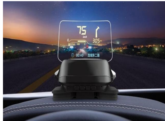
Рис. 2. Автомобільний HUD-проектор Xiaomi з підтримкою Bluetooth

Інформація про динаміку руху автомобіля, на яку водій повинен реагувати, відображається на щитку приладів. Проекційний бортовий індикатор ефективний для передачі інформації, якщо необхідно зберегти основну увагу водія на дорожній ситуації [13]. За допомогою бортового індикатора інформація відображається на вітровому склі (рис. 2).