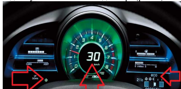
Рис. 6. Багатофункціональний інформаційний дисплей

індикатор на багатофункціональному інформаційному дисплеї (MID) і кольорове підсвічування навколо спідометра (рис. 6).