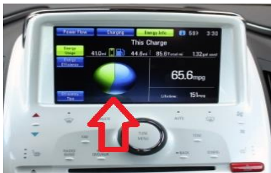
Рис. 7. Багатофункціональний дисплей автомобіля Chevrolet Volt

Джерела щодо інформаційної системи Chevrolet Volt наведені в [9-11]. Багатофункціональний дисплей автомобіля Chevrolet Volt показаний на рис. 7.