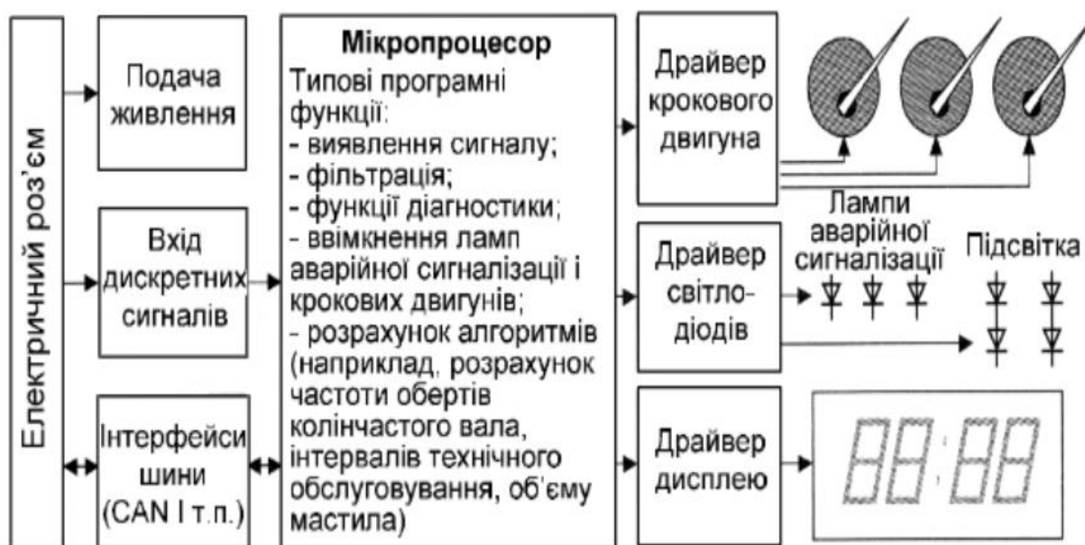
Рис. 4. Блок - схема функціонування комбінації приладів з використанням бортового контролера зв'язку CAN

використовується для передачі інформації, що пов'язана з безпекою руху, такої як: дотримання безпечної дистанції, попередження про небезпеку на дорозі, вказування маршруту руху. Основні функції основної комбінації приладів транспортних засобів є схожими, що зображено на рис. 4. Функціональні блоки, що включають в себе мікроконтролери, інтегральні схеми запам'ятовуючих пристроїв з програмами, стандартні зовнішні пристрої за характеристиками та типом дисплеїв значно відрізняються [4].