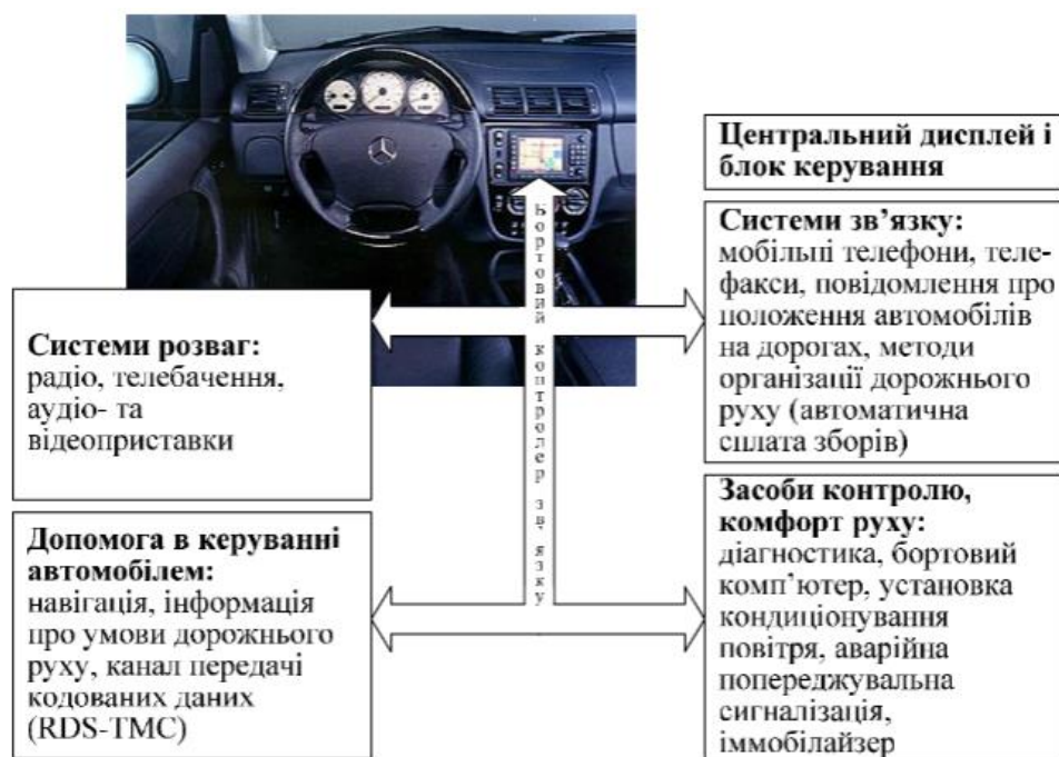
Рис. 1. Схема структурна інформаційної системи транспортного засобу