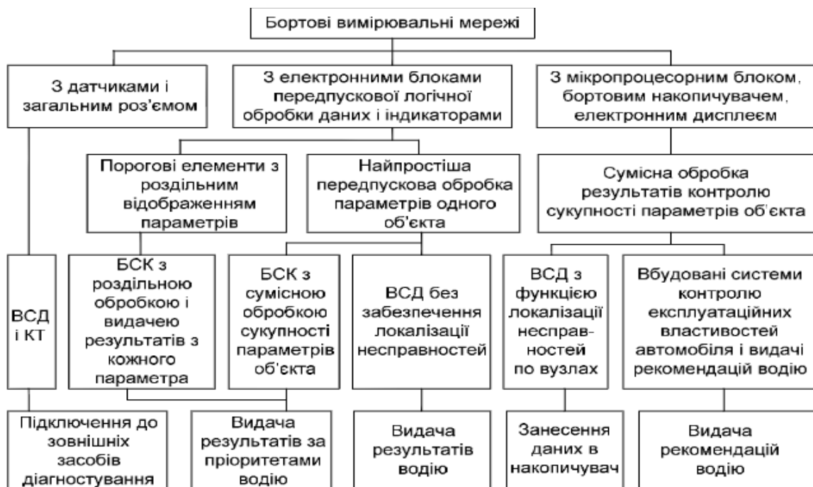
Рис. 5. Класифікація вбудованих засобів діагностування

функціонуючі в комплексі зі стаціонарними інформаційно-керуючими центрами мікропроцесорні системи для контролю, збирання та переробки результатів.