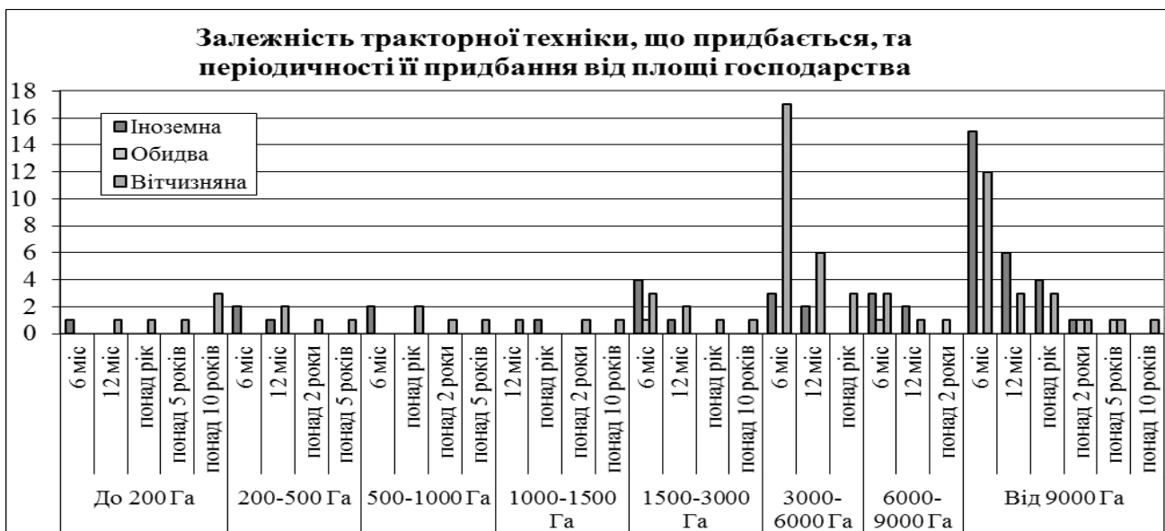
Рисунок 1 – Залежність тракторної техніки, що придбається, та періодичності її придбання від площі фермерських господарств