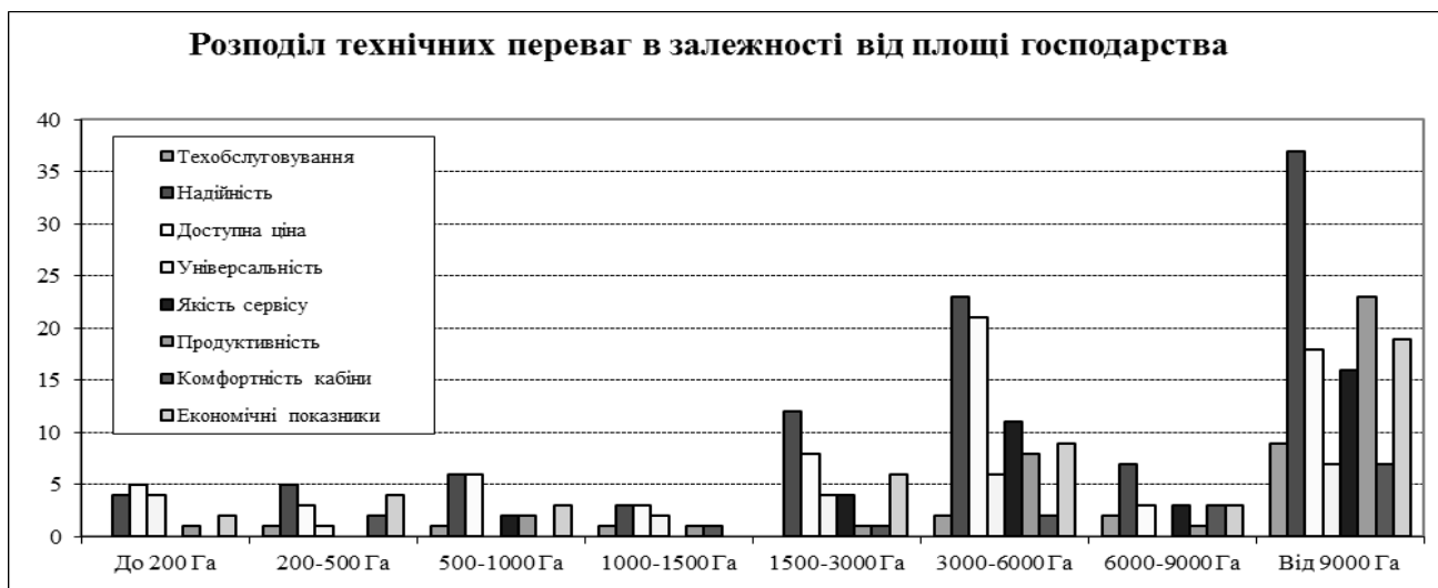
Рисунок 3 – Розподіл вимог до тракторної техніки в залежності від площі фермерських господарств