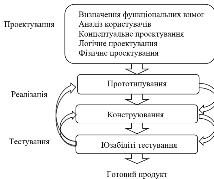
Рисунок 1. Етапи розробки інтерфейсу користувача

Дизайн користувацького інтерфейсу є фактором, який впливає на три основні показники якості програмного продукту: його функціональність, естетику і продуктивність. Для забезпечення успішної роботи користувача при проектуванні інтерфейсу потрібно дотримуватися балансу між перерахованими вище факторами протягом всього життєвого циклу розробки програми. Це досягається послідовним і ретельним опрацюванням деталей інтерактивної взаємодії на кожному з етапів розробки призначеного для користувача інтерфейсу (рис. 1).