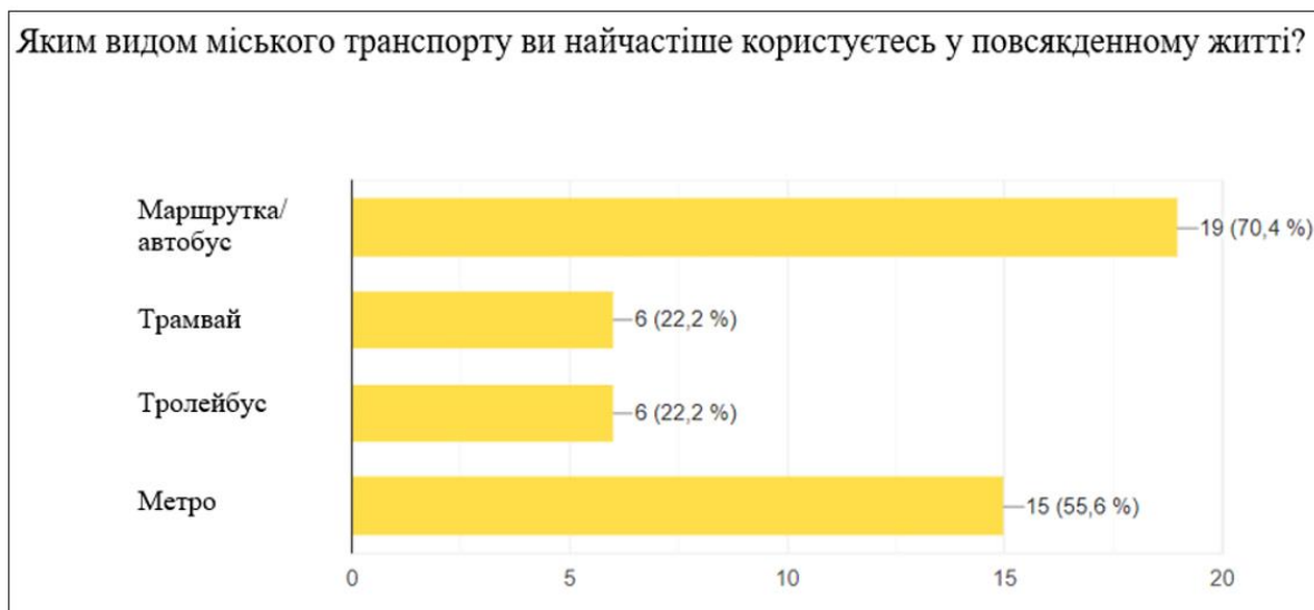
Рисунок 2 – Рейтинг популярності видів транспорту

Для фокус-груп було розроблено анкету з однаковим набором питань, але одна група відповідала у форматі заповнення онлайн анкети, а інша при комунікації. Респонденти виконували та проходили конкретні сценарії додатку. В процесі опитування було виявлено декілька ключових моментів а результати наведені на рис. 2 та рис. 3.