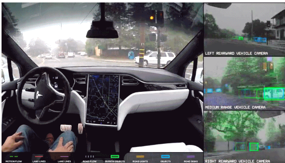
Рисунок 1 – Приклад візуалізації тривимірної моделі навколишнього середовища безпілотними автомобілями Tesla

В роботі розглядається актуальна задача розроблення бортової інформаційної системи БТЗ з використанням штучного інтелекту на прикладі сучасних мехатронних систем транспортних засобів, що виробляються провідними машинобудівними компаніями (рисунок 1).