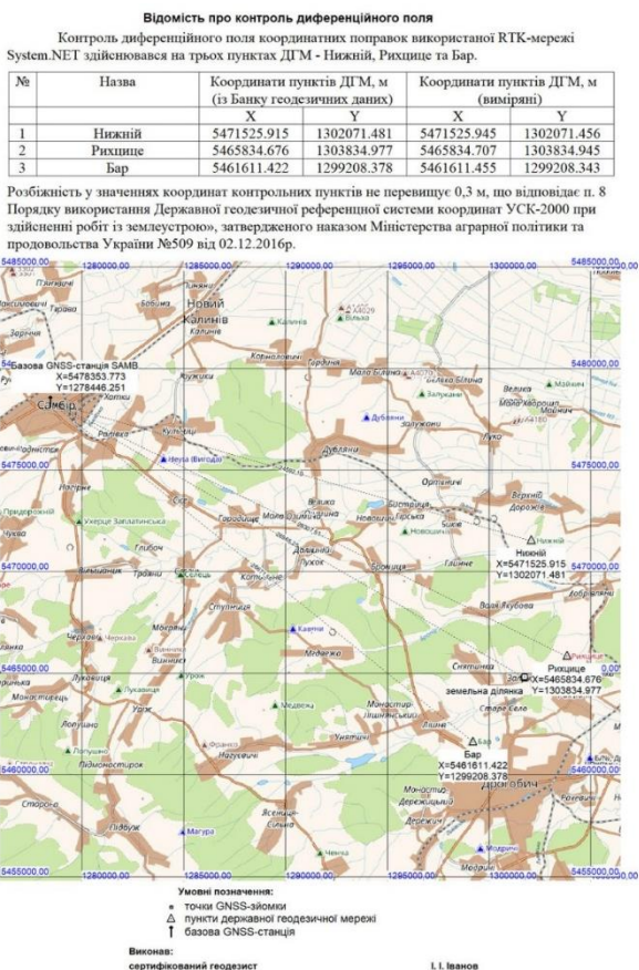
Рис. 3. Відомість про контроль диференційного поля

використання Державної геодезичної референційної системи координат УСК-2000 при здійсненні робіт із землеустрою» від 02.12.2016 р. №509 під час використання супутникових геодезичних приймачів ГНСС для визначення точок знімальної основи та зйомки геопросторових об'єктів із застосуванням технологій RTK розробниками документації із землеустрою перевіряється диференційне поле координатних поправок, які задаються мережами ГНСС (рис. 3).