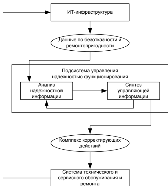
Рис. 2. Схема управления надежностью

Подсистема собирает информацию о текущей надежности ИТ-элементов и после соответствующего анализа корректирует программу обеспечения надежности и планы сервисного и ремонтного обслуживания.