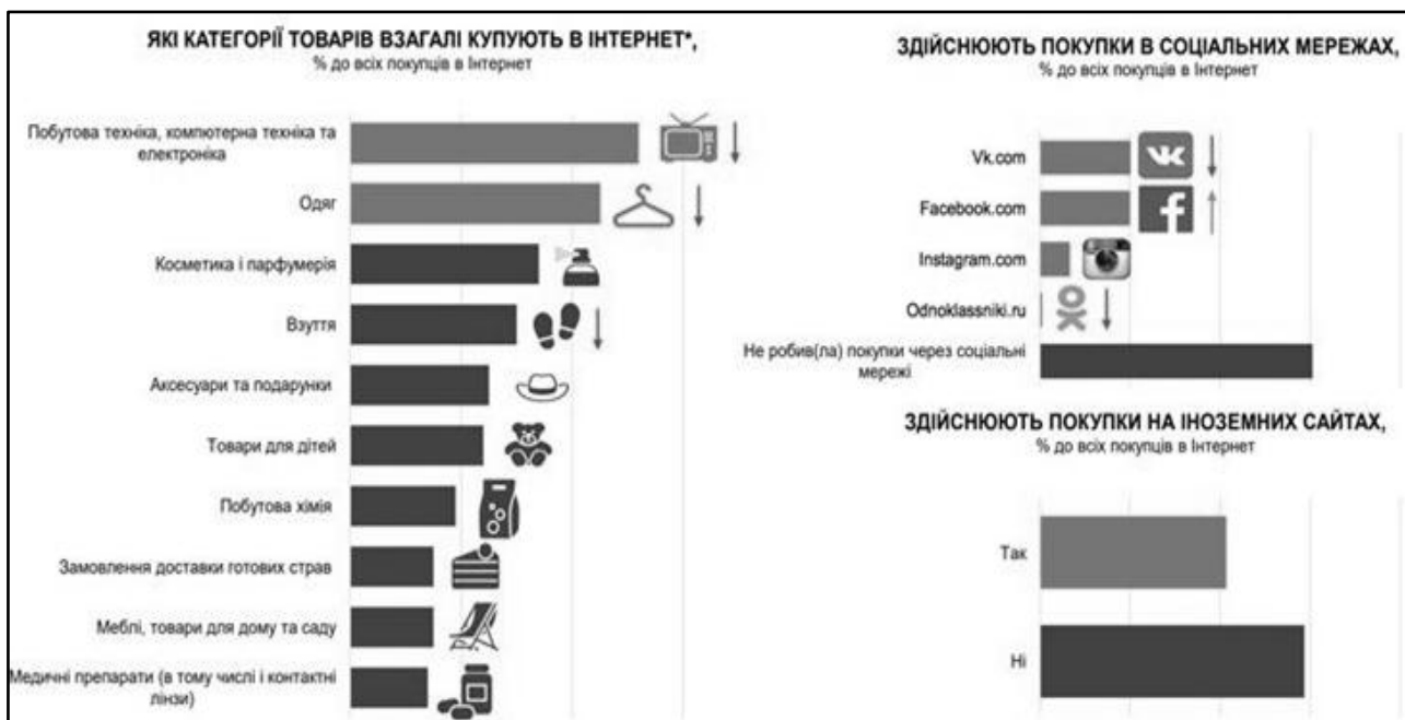
Рисунок 1 – Графік покупок через Интернет в Україні

Из графика видно, что украинцы покупают абсолютно все виды товаров через сеть. Отдельно нужно учитывать, что на данный момент, в связи с нестабильным и опасным положением во всем мире покупки в Интернете стали не только облегчать жизнь в экономии времени, но и ещё существенно ограничивают нас от контакта с другими людьми, что в свою очередь является большим облегчением в жизни.