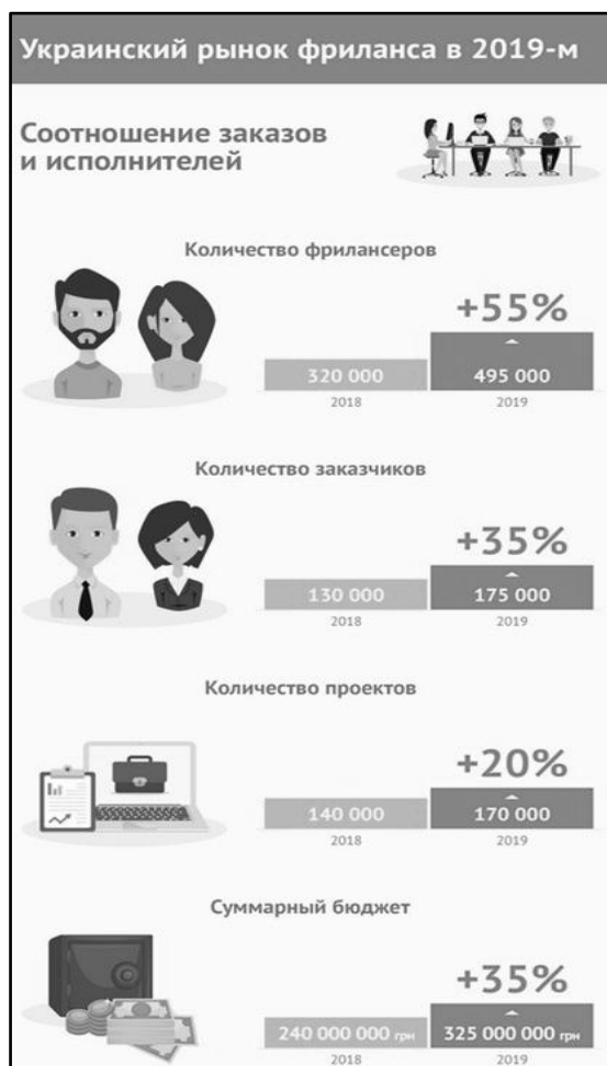
Рисунок 3 – Рынок фриланса в Украине, 2019 г.

даже она даёт возможность понять интерес населения касаясь фриланса.