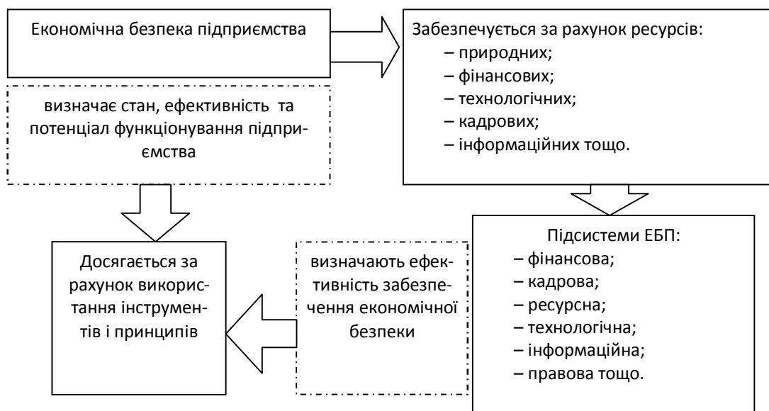
Рисунок 1 – Зв'язок складових ЕБП та об'єктів безпеки

Таким чином, концепція економічної безпеки підприємства має представляти цілісне уявлення про мету, завдання, принципи та інструменти її досягнення (рис. 2).