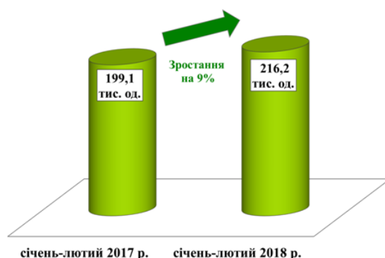
Рисунок 1. Кількість вакансій в Україні

Ситуація із збільшення кількості вакансій простежується і на початку 2018 р., так як за період січень-лютий 2018 р. кількість вакансій зросла на 9 % у порівнянні з січнем-лютим 2017 р. (рис. 1).