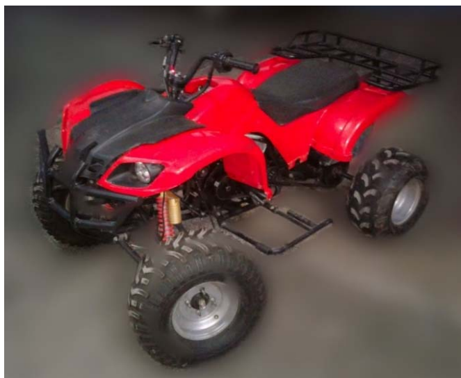
Рис. 2. Електроквадроцикл, створений на кафедрі автомобільної електроніки ХНАДУ

Електроквадроцикл має наступні технічні характеристики: повна відсутність шкідливих викидів у атмосфері; максимальна швидкість: 40 км/годин; пробіг на одній зарядці до 50 км; тягова акумуляторна батарея, що не обслуговується, ємність 60Ah 60В; електродвигун вентиляного типу, потужність: номінальна 2,5кВт; пікова 6 кВт; ресурс акумуляторів 8 років. Час зарядки акумуляторів: 2 – 6годин в залежності від потужності мережі живлення. Маса електроквадроцикла 180 кг, маса причепа, що буксирується 350 кг.