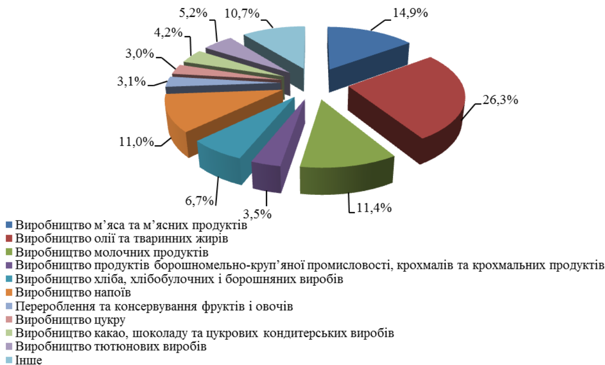
Рис.1. Структура реалізованої продукції харчової промисловості у 2018 році * складено автором на основі [3;6]

Для дослідження тенденцій галузі проаналізуємо спершу динаміку індексів промислової продукції виробництва харчових продуктів, напоїв та тютюнових виробів за 2013 – 2018 рр. (рис.2).