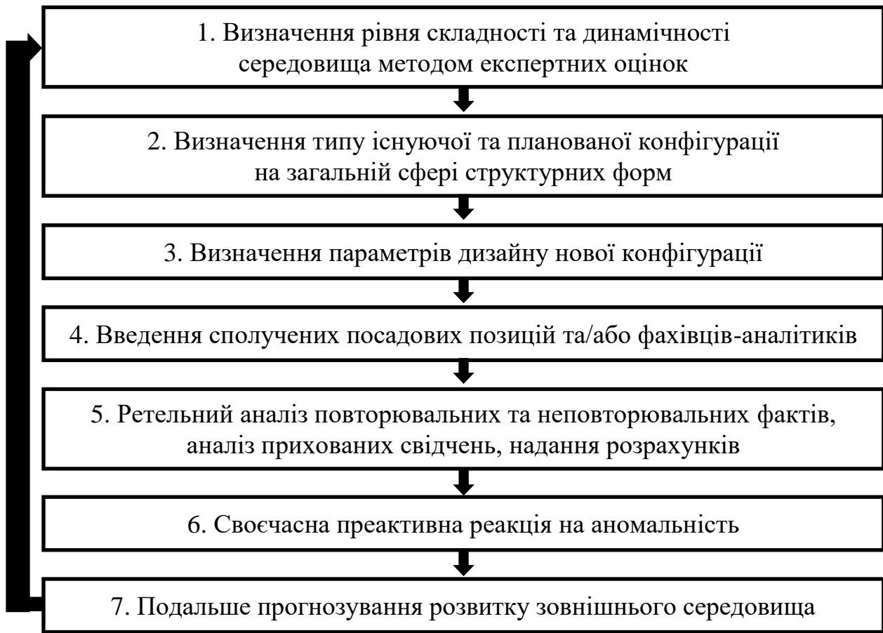
Рис. 3. Основні етапи підходу до трансформації організації за умов мінімізації впливу аномальності середовища надання розрахунків